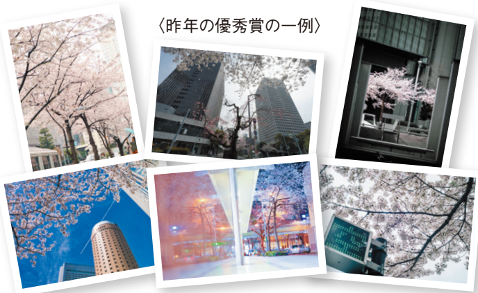
〈昨年の優秀賞の一例〉

※ご連絡が指定の期限内にない場合は入選を無効とさせていただきますのでご注意ください。