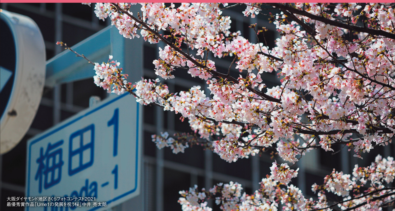
大阪ダイヤモンド地区さくらフォトコンテスト2021 最優秀賞作品「Ume1の発展を祝う桜」中井 亮太郎