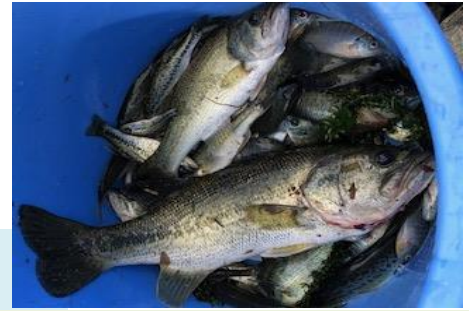
こんなにいっぱい外来魚！