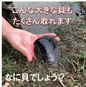
こんな大きな貝も たくさん取れます